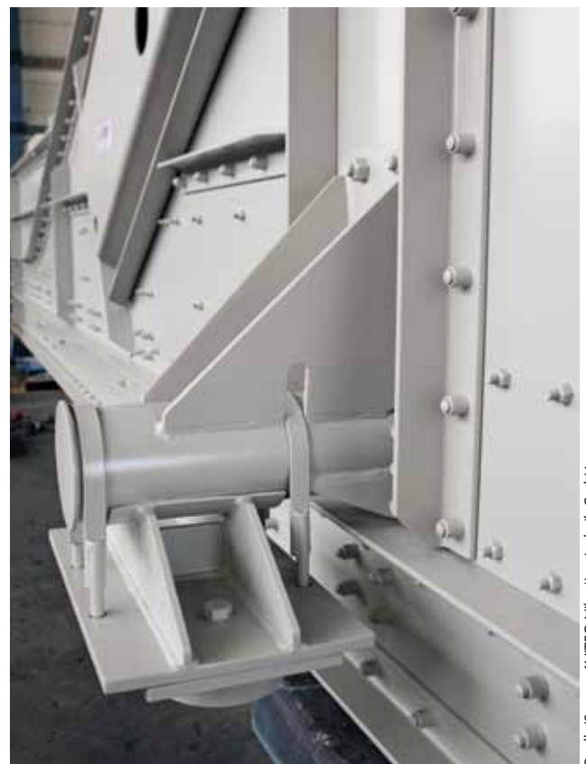
4 Gehuckte Konstruktion • Hucked design

In a tunnel boring project in Italy, precisely this technology is needed. A large volume of tunnel rubble has to be processed on site to enable its transport off-site and further process-