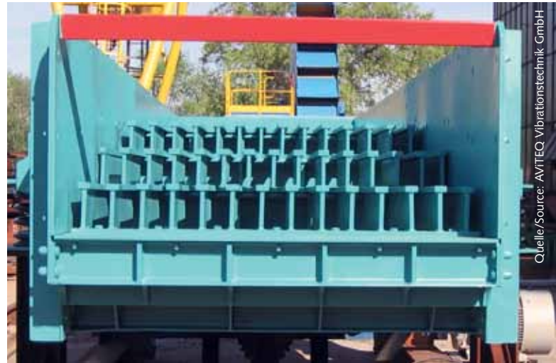
3 Grobabscheider für Tunnelbruch • Coarse separator for material excavated from a tunnel